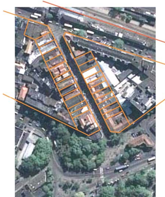
Figura 4: Estrutura parcelária principal